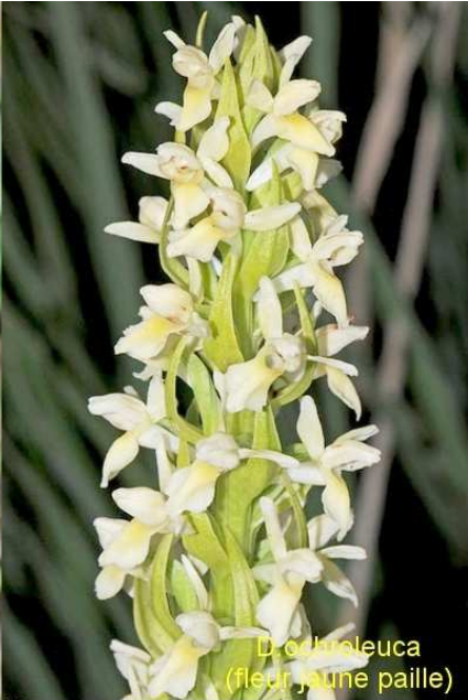
D. cultrata (fleur jaune paille)