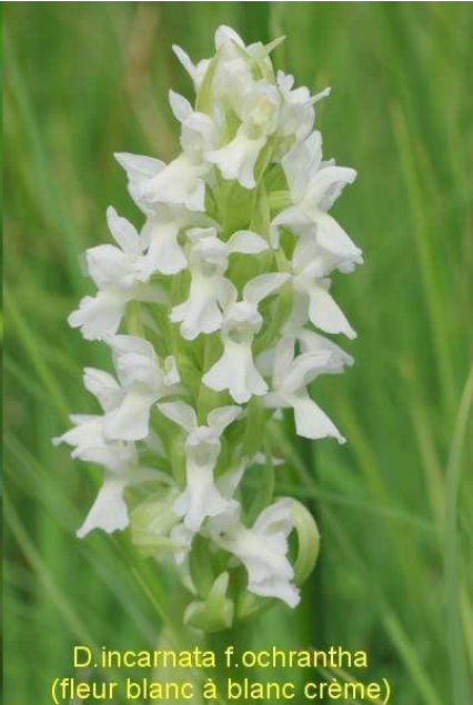
D. incarnata f. ochrantha (fleur blanc à blanc crème)