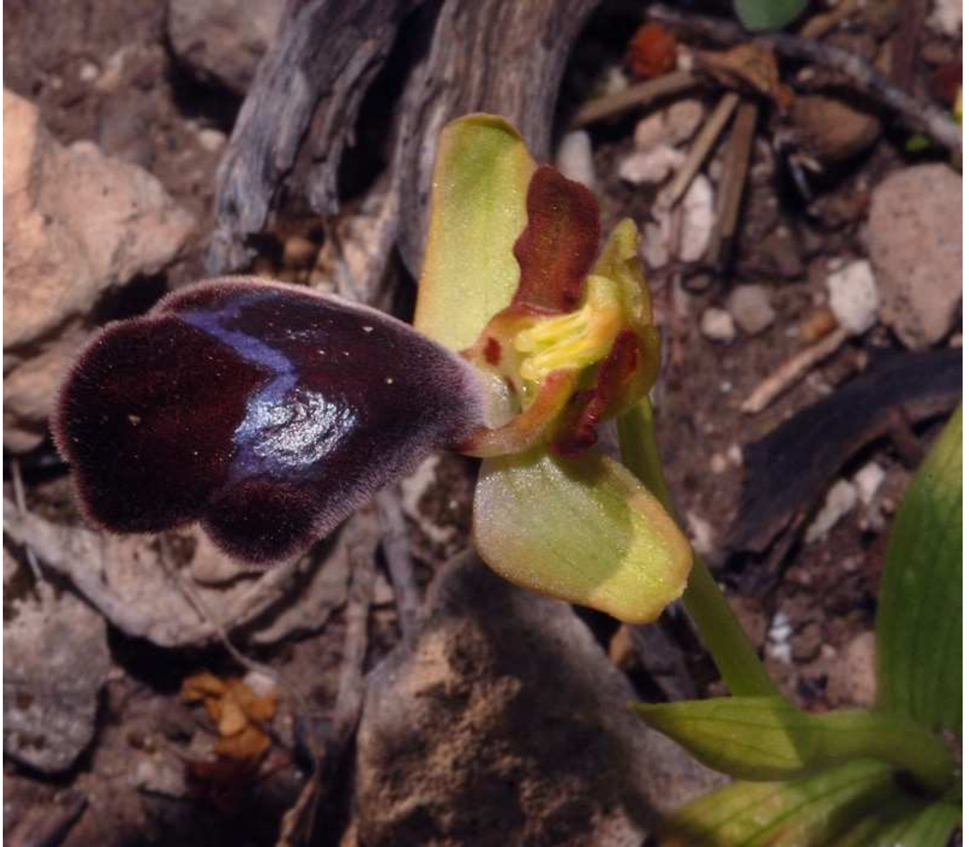
enfin O. omegaifera :