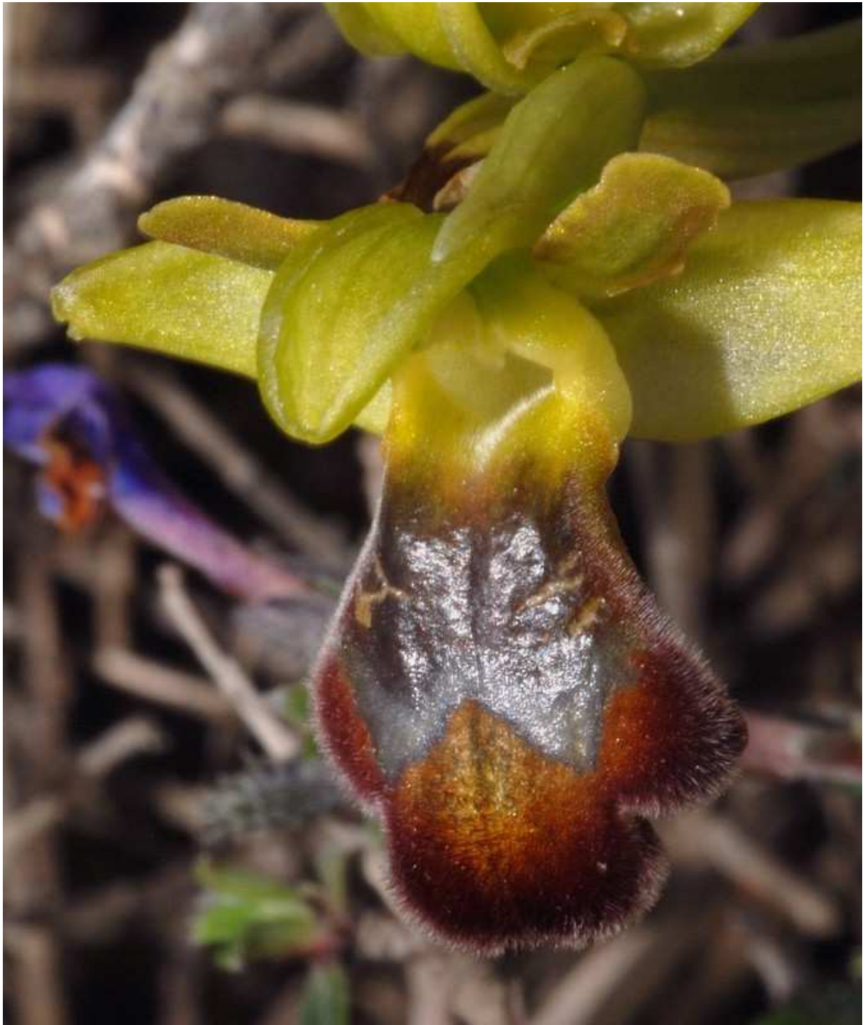
O. basilissa, précoce et très gros: