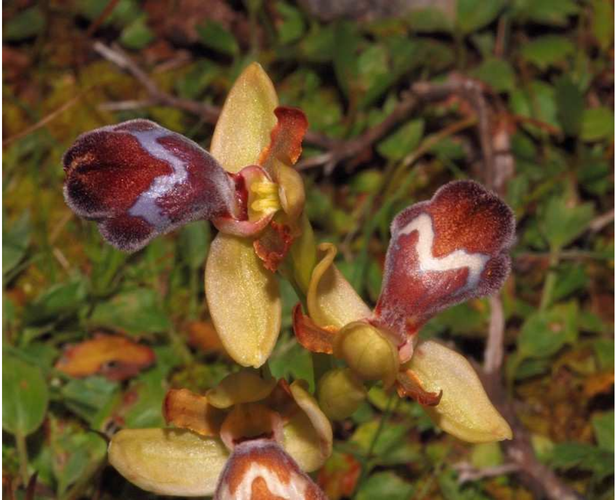
O. apollonae , au labelle assez étroit à la base, moins élargi, plus foncé, et avec les fleurs orientées vers le haut: